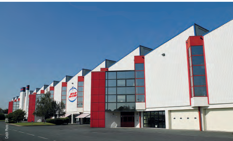
SIB occupe un site de 20 000 m 2 avec encore un fort potentiel d'extension à Mortagne-sur-Sèvre (85)

La Société d'Innovation du Bâtiment (SIB) vendéenne signe la conception et fabrication de fermetures premium, diversifiant ses gammes au fil des mutations et de l'évolution de l'habitat, rythmées par des programmes d'investissement structurels continus tournés vers l'avenir. Confiance et audace caractérisent cette entreprise qui entretient son avance tout en prenant le temps de la réflexion.