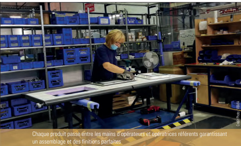
Chaque produit passe entre les mains d'opérateurs et opératrices référents garantissant un assemblage et des finitions parfaites

couissant sans rail apparent pour une intégration parfaite à la façade, sont indissociables de l'habileté et des capacités autant conceptuelles que techniques de l'industriel.