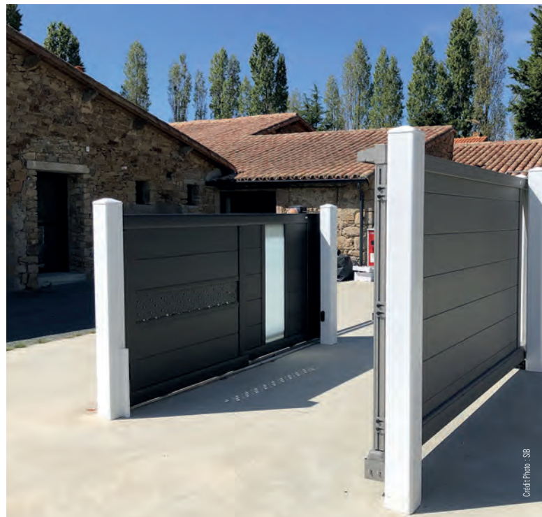
SIB compte renforcer un service client premium tout en encourageant la formation (service à la pose, vente...) et les rencontres dans son showroom et centre de formation particulièrement accueillant